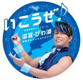
滋賀ふるさと観光大使 西川貴教

ちょっとうれしい おトク付き! 協力: 滋賀県・びわこビジターズビューロー ※詳しくは裏面をご覧ください。